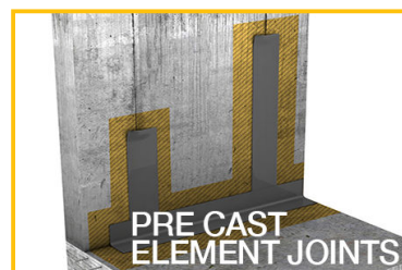
PRE CAST ELEMENT JOINTS